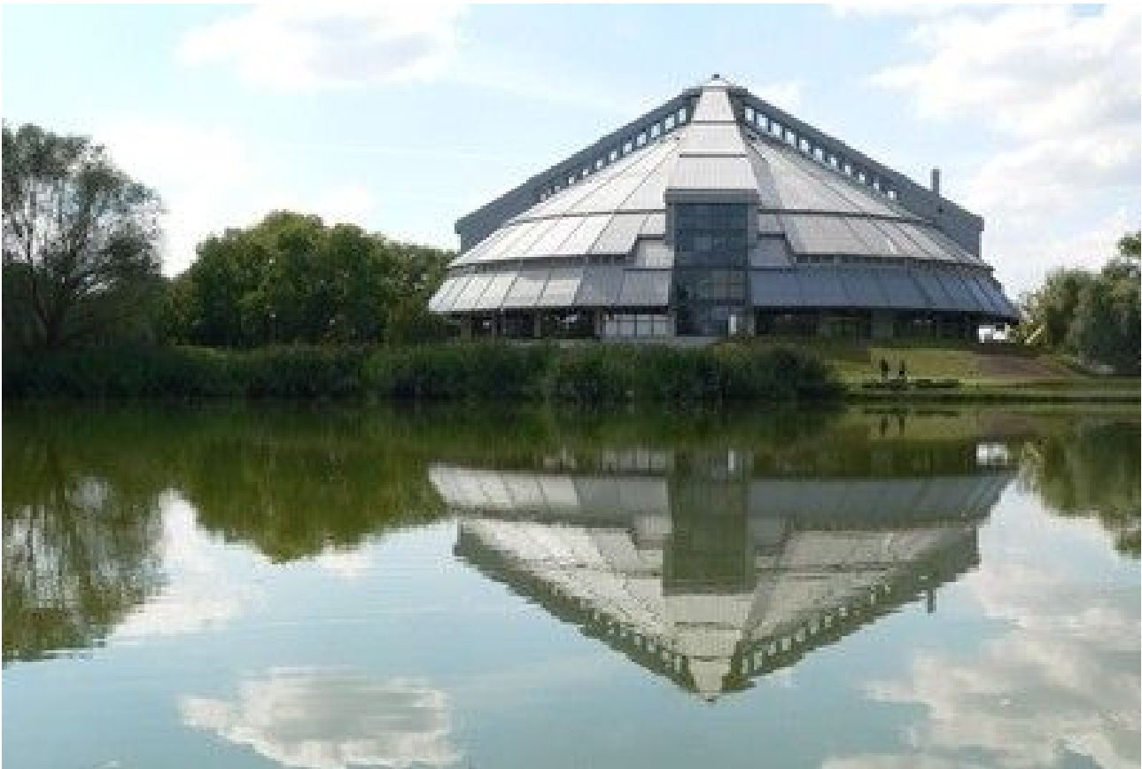
Rotunda (Látogató központ)